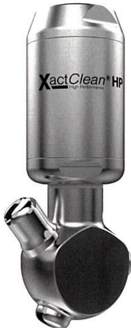
Der Rotationsreiniger Xactclean HP aus der gleichnamigen Baureihe fällt in die Reinigungseffizienzklasse 4 und eignet sich damit zum Beseitigen von mittleren bis hartnäckigen Verschmutzungen