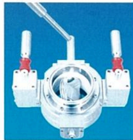
Müller Containment Klappe MCV